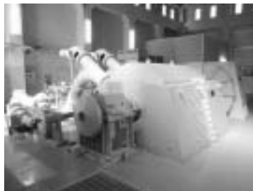
図13 横軸二輪四射ペルトン水車 (和合発電所)