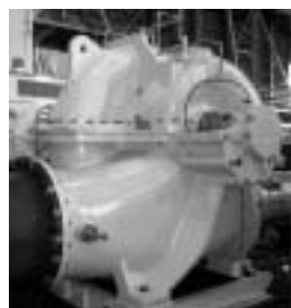
図1 高ns大型両吸込渦巻ポンプ(クボタ)