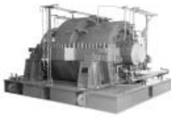
図16 プロパン脱水素プラント用大型圧縮機(三菱重工コンプレッサ)