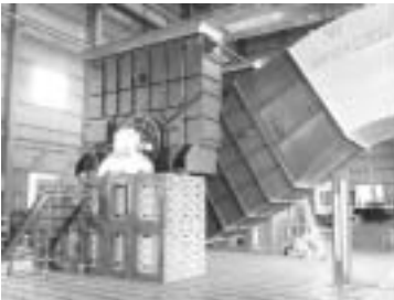
図 21 大手化学会社向け2,500 kWボイラー用IDF (日本機械技研)