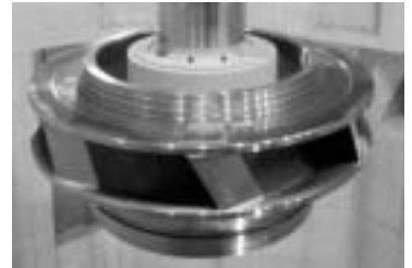
図11 立軸フランス形ポンプ水車 (京極発電所)