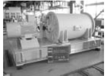
図 20 地方自治体向け下水曝気送風機 (荏原製作所)