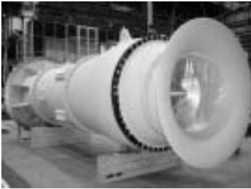
図4 復水器冷却循環水ポンプ(三菱)