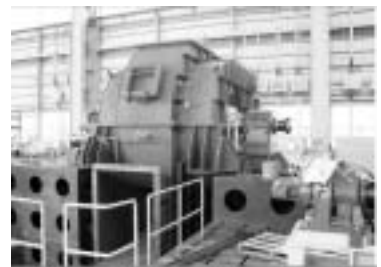
図14 インド製鉄所向け (荏原ハマダ)