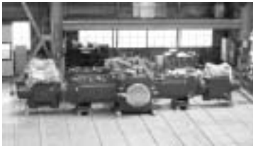
図 18 石油精製用大型往復動圧縮機 (三井造船)