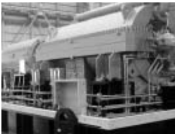
図15 中国石油化学プラント向けターボ圧縮機(荏原エリOTT)