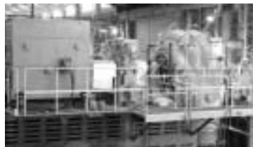
図 19 海外向けCOGブロワ (1,200 kW) (電業社)