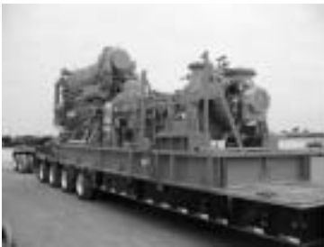
図7 インラインブースタポンプ(電業社)