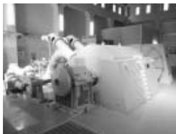
図13 横軸二輪四射ペルトン水車 (和合発電所)