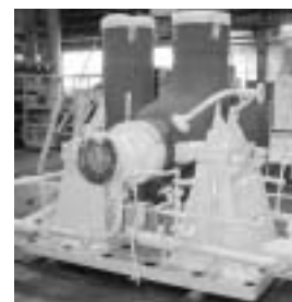
図3 次世代加圧水型原子炉「AP1000」 高温・高圧仕様主給水ポンプ(三菱)