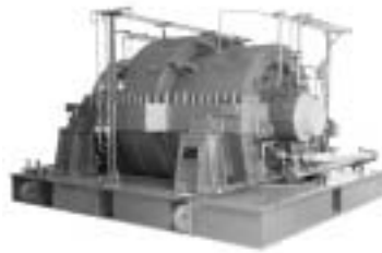
図16 プロパン脱水素プラント用大型圧縮機(三菱重工コンプレッサ)