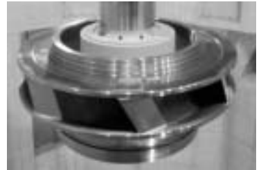
図11 立軸フランシス形ポンプ水車 (京極発電所)