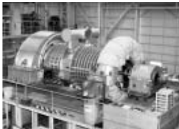
図 22 高炉用軸流圧縮機 (三井造船)