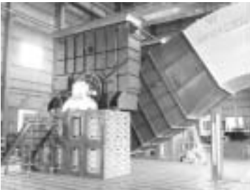
図 21 大手化学会社向け2,500 kWボイラー用 IDF(日本機械技研)