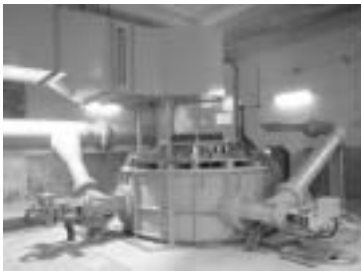
図9 立軸四射ペルトン水車 (大町新堰発電所)