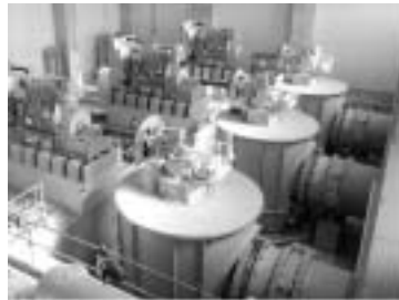
図5 口径1,500 mm立軸軸流ポンプ(鶴見)