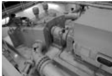
図10 横軸単輪二射ターゴ水車 (小早月発電所)