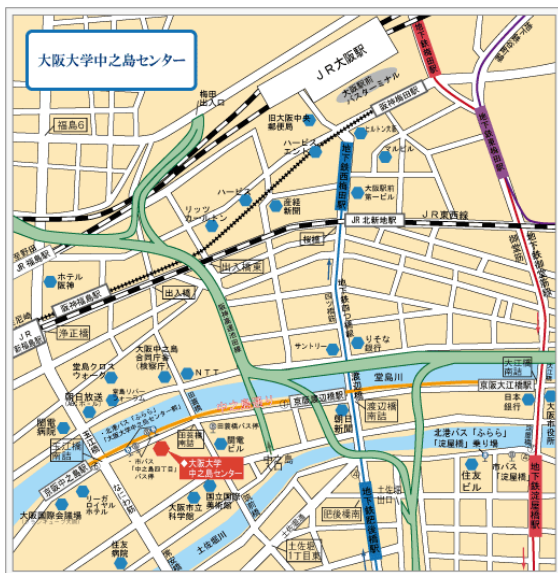
( http://www.onc.osaka-u.ac.jp/others/map/ )