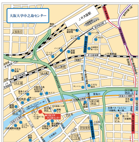
( http://www.onc.osaka-u.ac.jp/others/map/ )